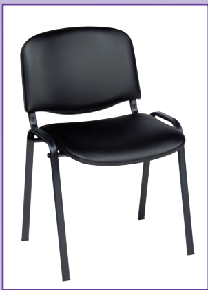
POLTRONCINA FISSA MOD. 1000 Realizzata in fusto conificato nero, imbottitura in resina e rivestimento in SKAY, accatastabile.