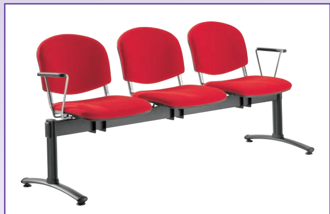
PANCHE ATTESA MOD. 1013/3 Seduta imbottite su barra per sale d'attesa. Sono disponibili nelle versioni da 2, 3 e 4 posti con eventuale tavolino poggiarivista. Il rivestimento del sedile può essere in similpelle o tessuto.