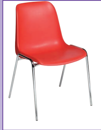
SEDIA MOD. ELENA Struttura cromata, scocca in polipropilene COLORI: ROSSO, BLU, GRIGIO E NERO