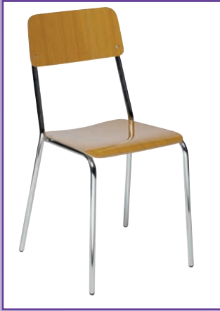
SEDIA LAMINATO colore Teak