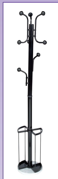
Mod. 551 col. nero