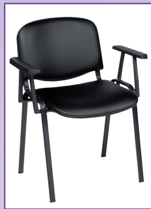
POLTRONCINA FISSA MOD. 1000 CON BRACCIOLI Realizzata in fusto conificato nero, imbottitura in resina e rivestimento in SKAY, con braccioli, accatastabile.