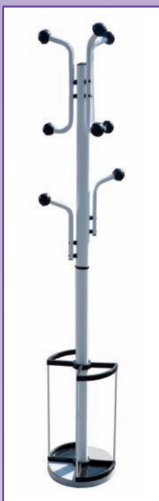
Mod. 551 col. bianco