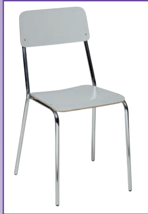
SEDIA LAMINATO colore Grigio