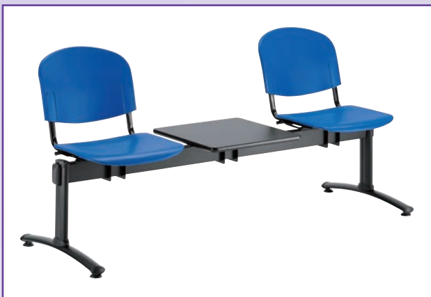
PANCHE ATTESA MOD. 1000 Seduta imbottite su barra per sale d'attesa. Sono disponibili nelle versioni da 2, 3 e 4 posti con eventuale tavolino poggiarivista. Il rivestimento del sedile può essere in similpelle o tessuto.